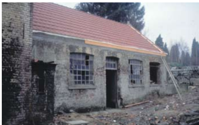
Het oude schoolgebouwtje, op de hoek van de Reebokweg en de Brusselsesteenweg, net voor de afbraak

De gemeenteschool op de Brusselsesteenweg is maar één van de scholen die Jezus-Eik rijk is. Op, in vogelvlucht, enkele honderden meters ligt de gemengde basisschool, waar mening Jezus-Eikenaar school liep.