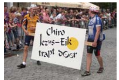
Het feestjaar van Chiro Bosuil begint met de overwinning van de Druivenstoet 2010. Proficiat !